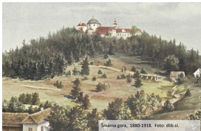
Šmarna gora, 1880-1918.

»Šmarna gora je nekak tolažnik sprehoda železnih Ljubljančanov in Ljubljančank; cele karavane so lezle v nedeljo proti njenemu vrhu ...«, je zapisano v časopisu Slovenski dom leta 1936.