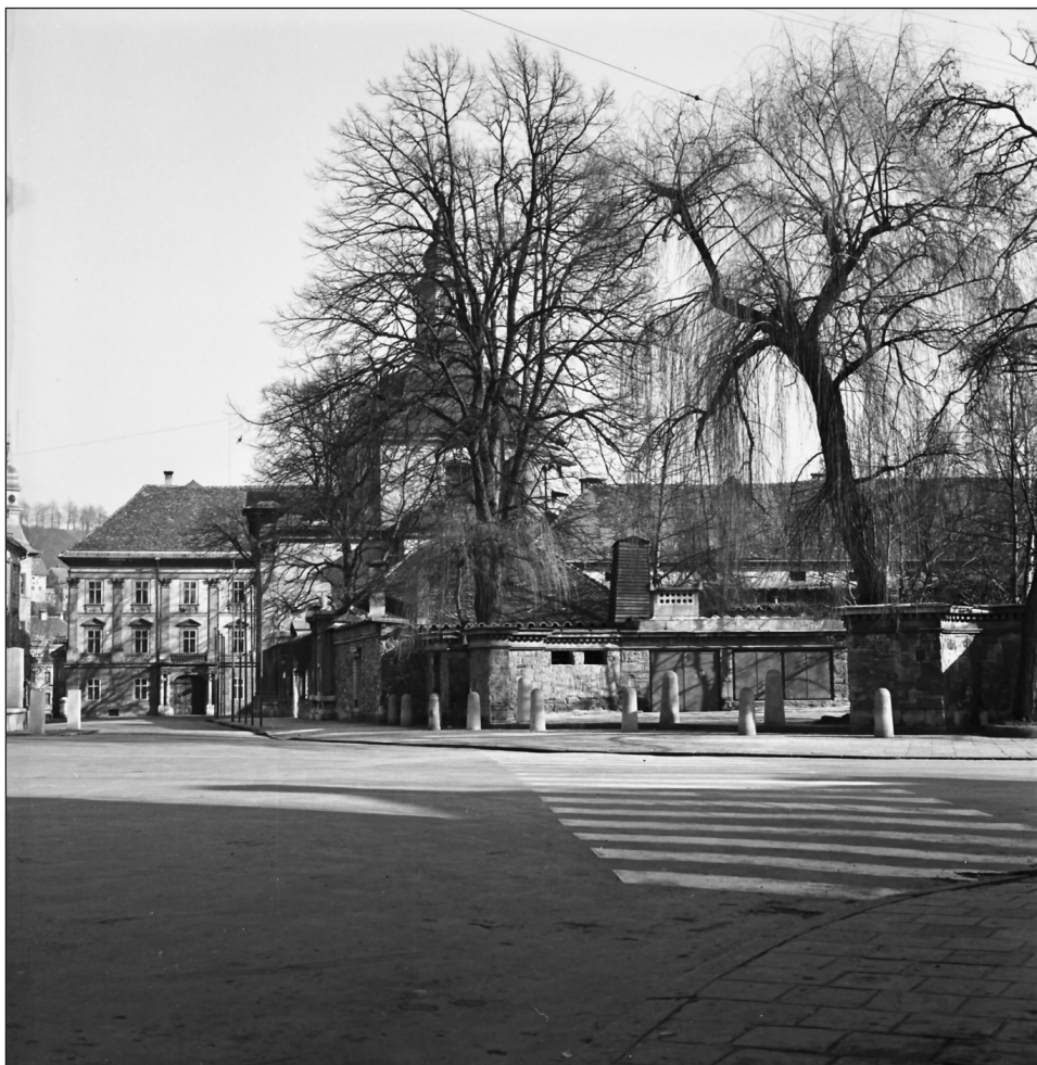
Križanke v Ljubljani