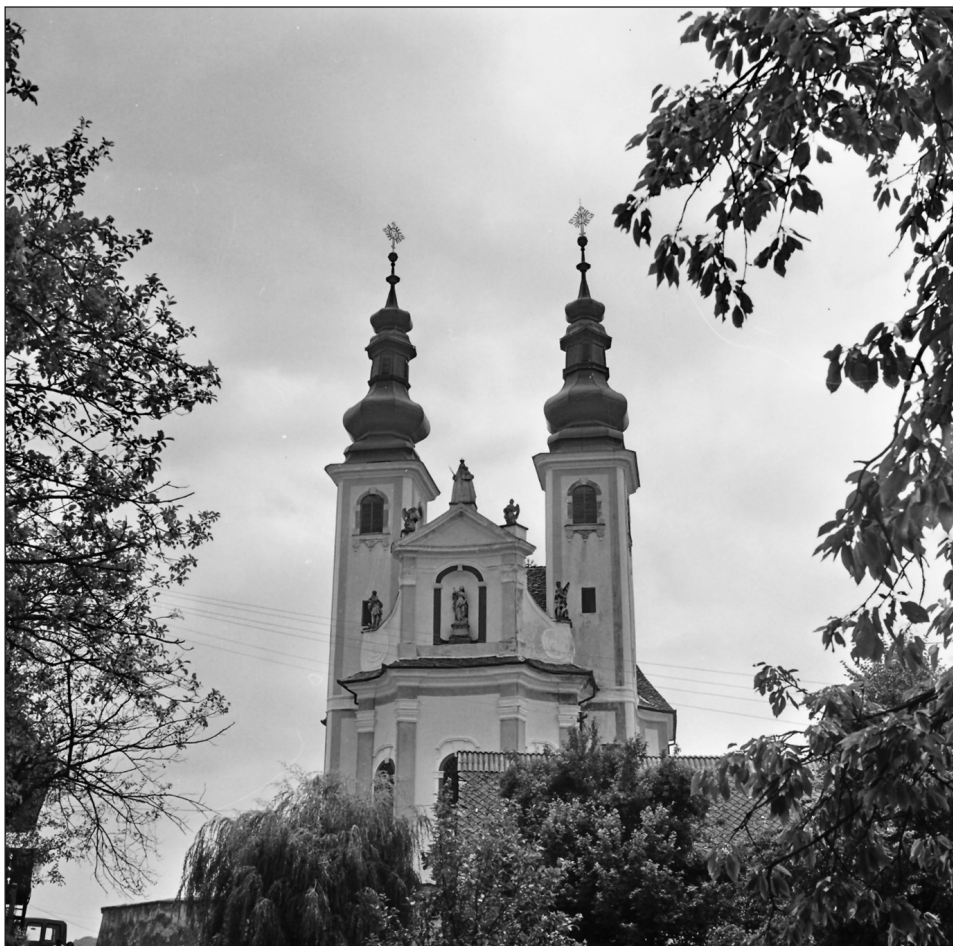
Cerkev Čudodelne Matere Božje in sv. Marjete Antiohijske na Sladki Gori