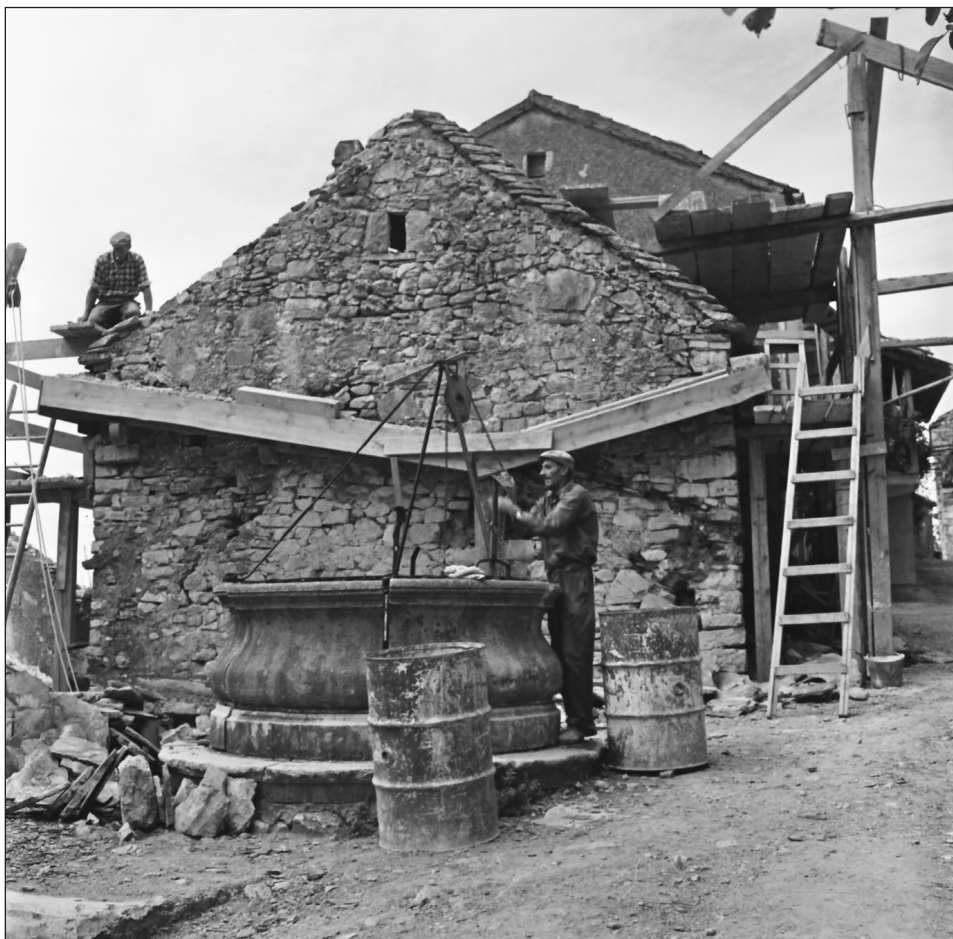
Kraška hiša v Štanjelu