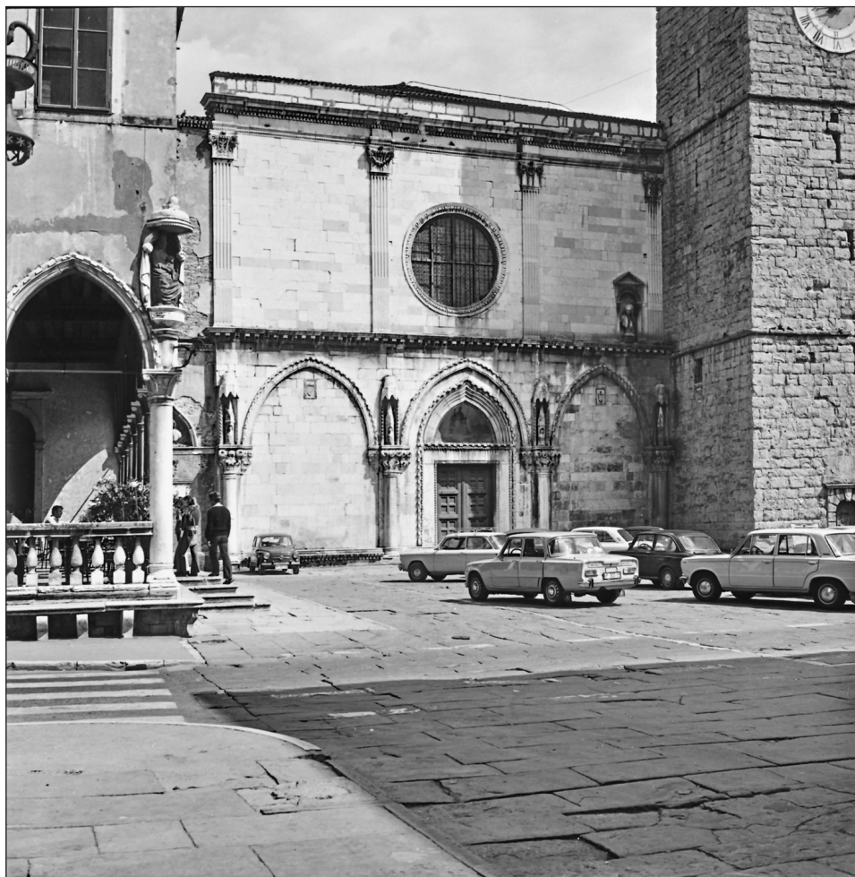
Stolnica Marijinega vnebovzetja v Kopru