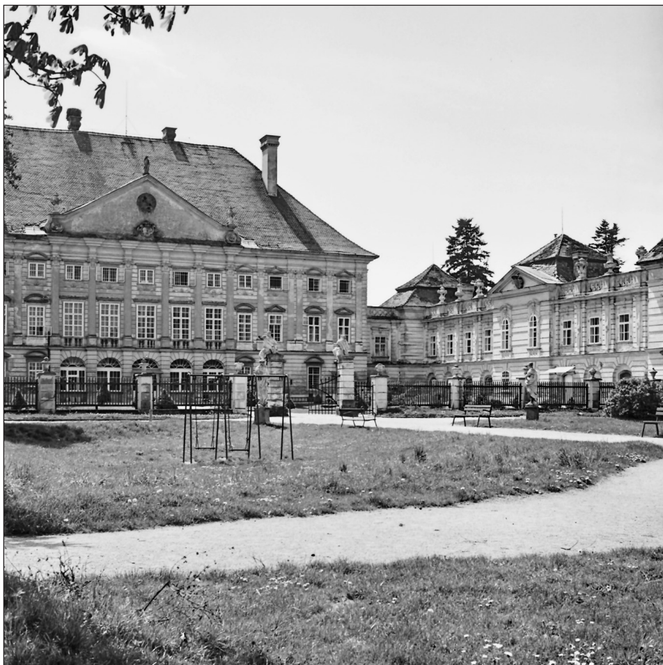
Vrtni del dvorca Dornava