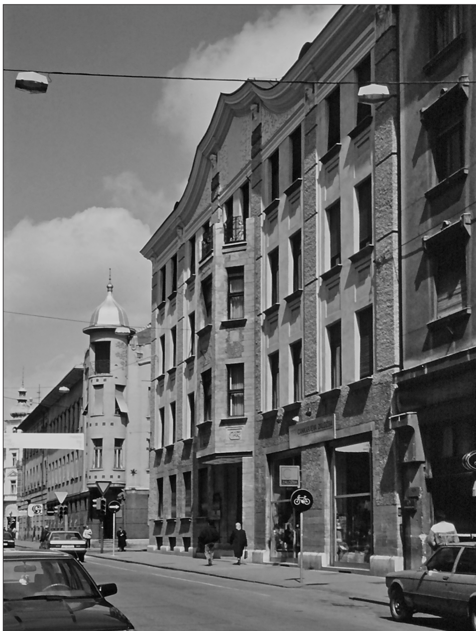
Bambergova hiša v Ljubljani, foto Nace Šumi, Fototeka Oddelka za umetnostno zgodovino FF UL