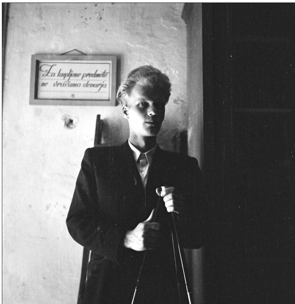
Avtoportret okoli leta 1950