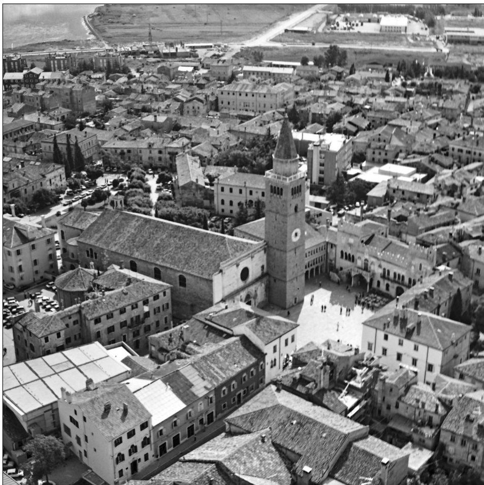
Zračni pogled na stolnico Marijinega vnebovzetja v Kopru, foto Nace Šumi, Fototeka Oddelka za umetnostno zgodovino FF UL