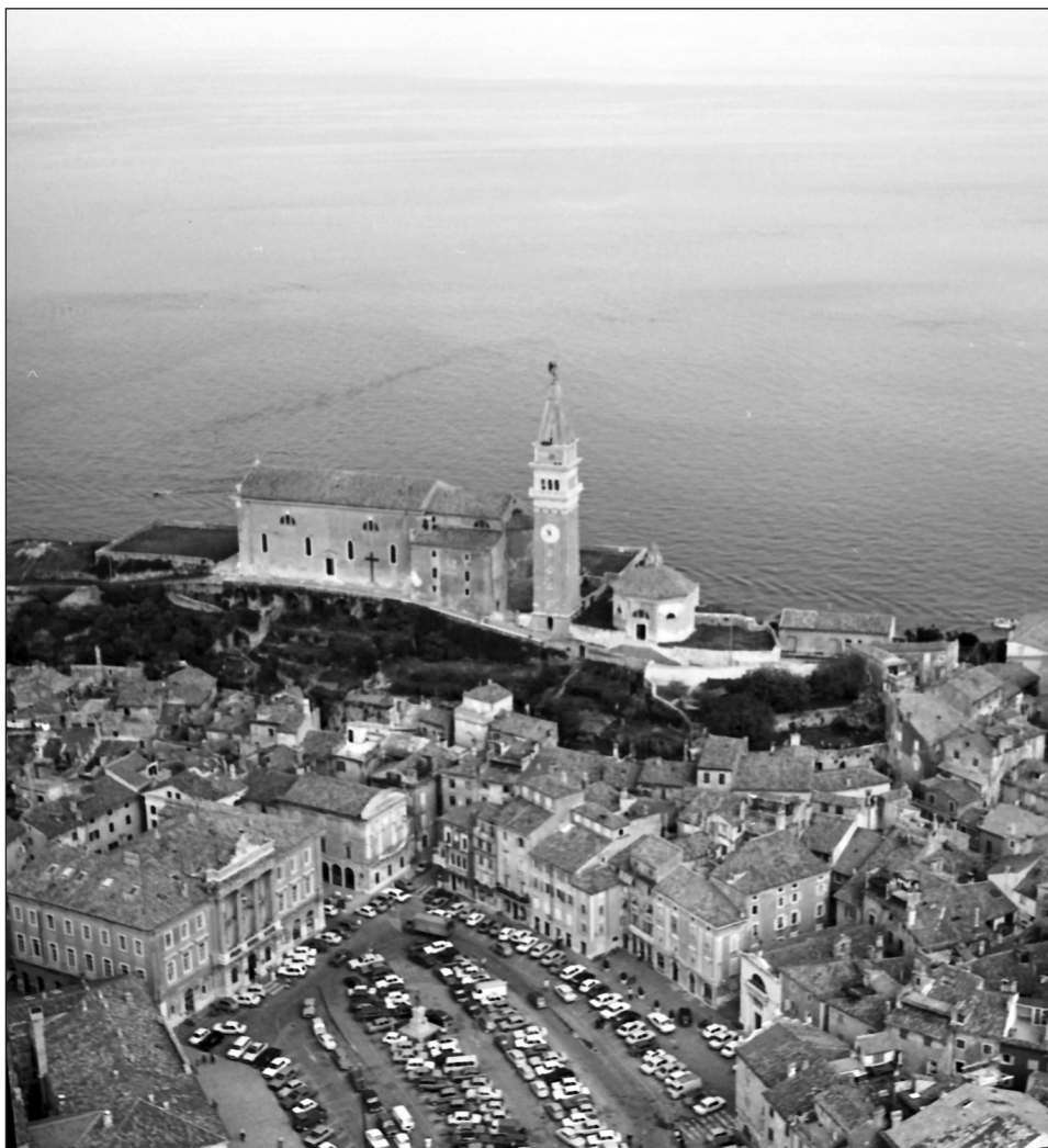
Zračni pogled na Piran