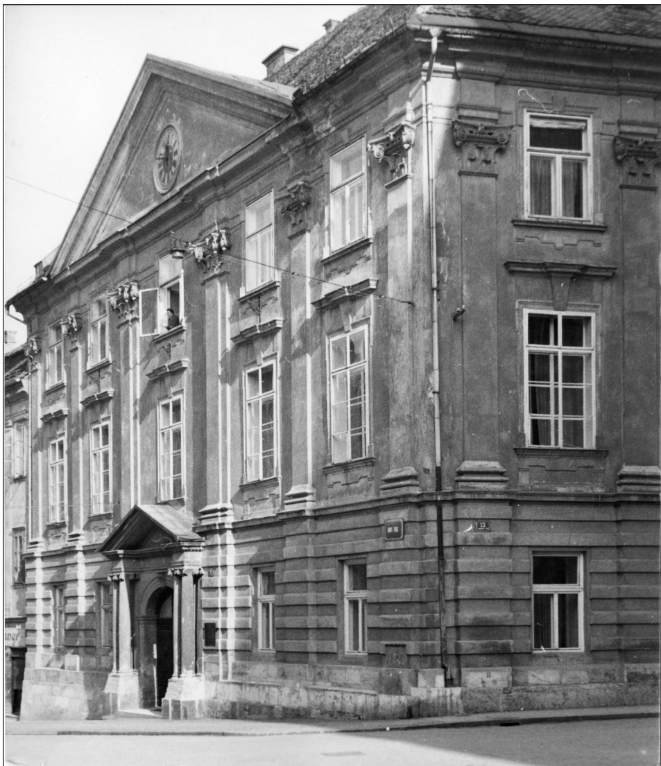
Lontovž na Novem trgu 3 v Ljubljani, foto Nace Šumi, Dokumentacija ZVKDS, OE Ljubljana