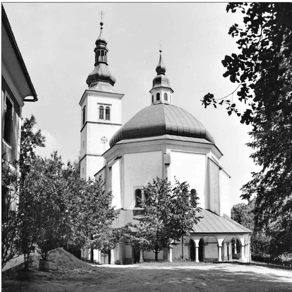
Cerkev Marijinega vnebovzjetja v Novi Štifi